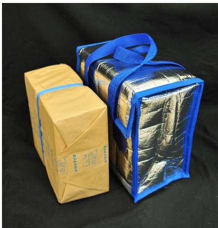
コールドパック(Cパック)のみ

どうぞ当社オリジナルドライアイス専用保管ボックスをご活用頂き、葬儀社様の経営の一助にお役立て下されば幸いです。