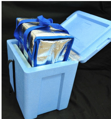
コールドパック(Cパック) + 専用保管ボックス